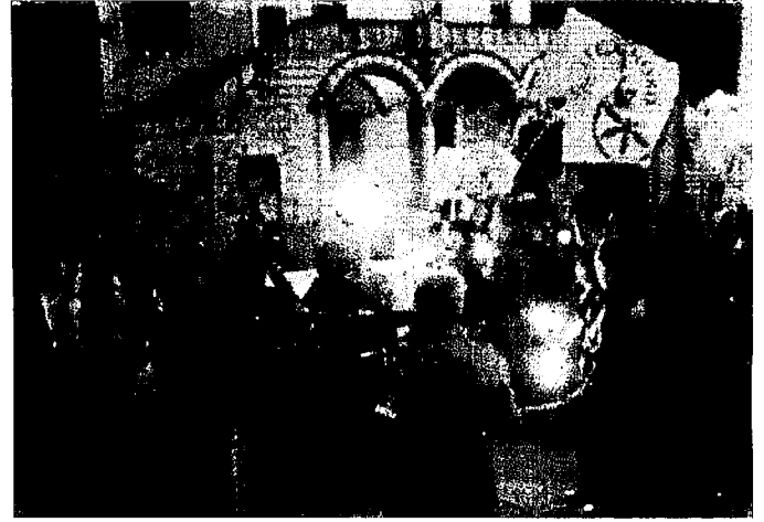
«RIBELLIAMOCI» Due diversi momenti della manifestazione svoltasi sabato notte in centro e organizzata dalla Lega Nord